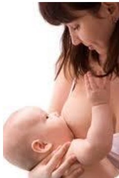
Interaction parent- enfant