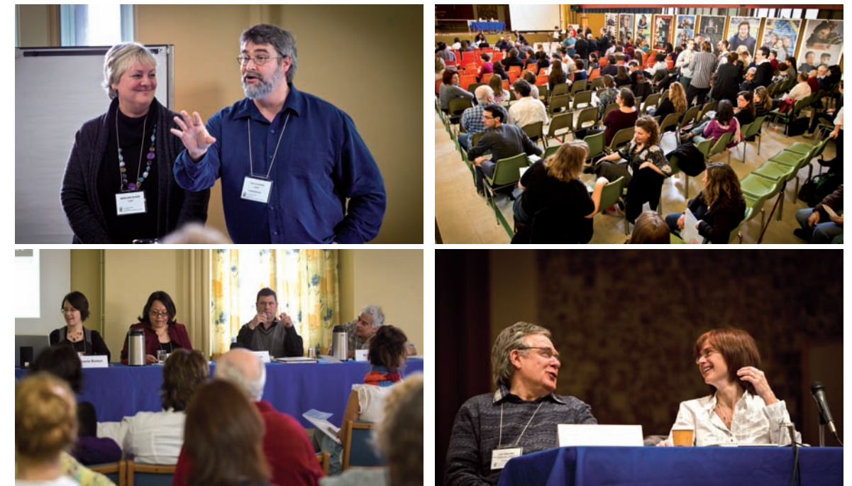
Photos de la cinquième Su-Père conférence, 17 février 2011