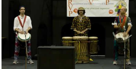
Afrique en mouvement