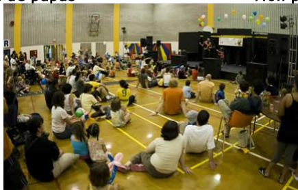
Spectacle sur scène