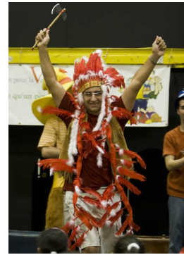
Vive les pères !