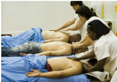
Massage de papas