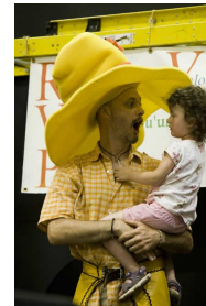
Mon père, ce héros