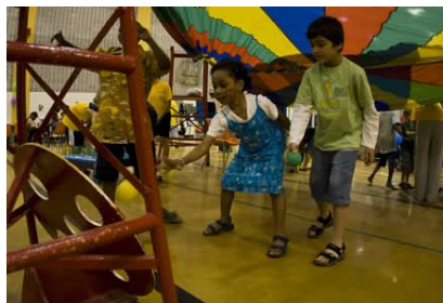
Kiosque de kermesse