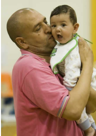
Je l'aime mon bébé !