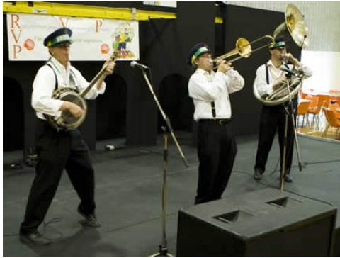
Trio Tonique Swing jazz band